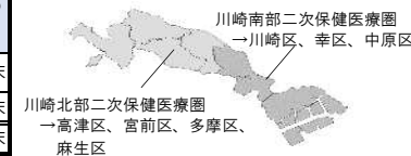
【川崎市内の二次保健医療圏】