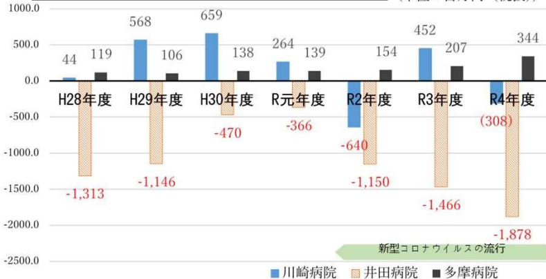
図 病院事業会計における各病院の経常損益の推移（単位：百万円（税抜））