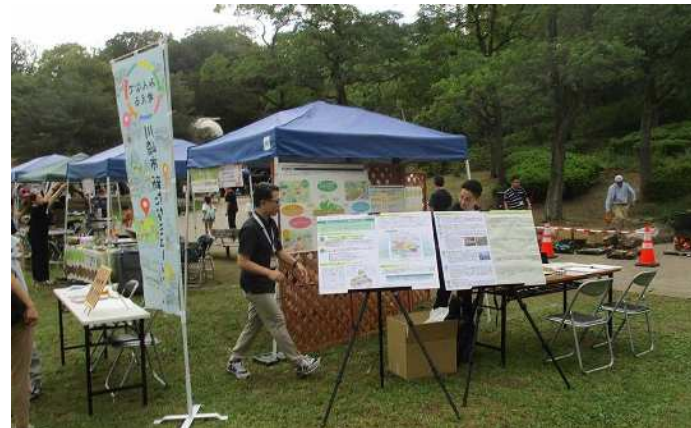
オープンハウス会場の設置状況