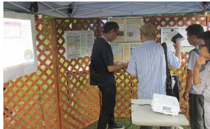
質疑応答の実施状況