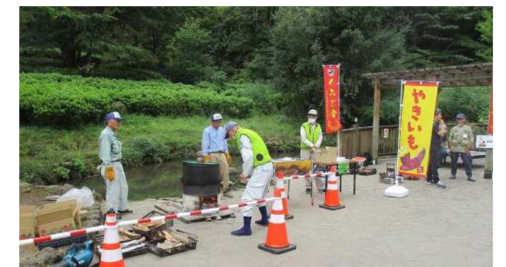
オープンハウスと合わせて実施した薪割体験