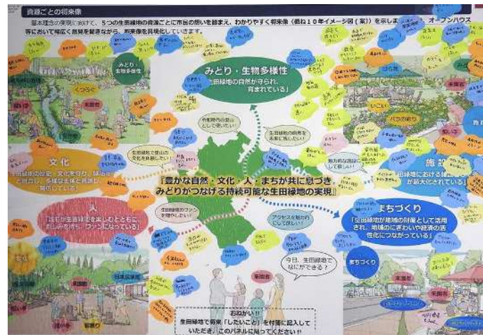
意見の記入・張り込み状況