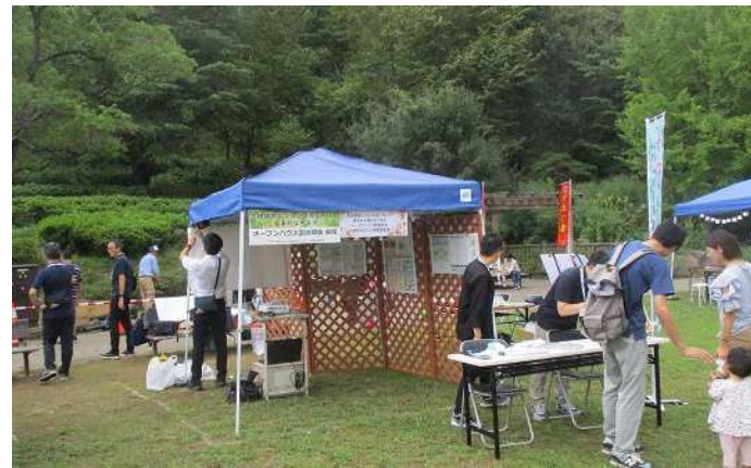
オープンハウス会場の設置状況