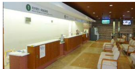
総合受付カウンター