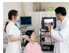
耳鼻咽喉科外来 (嚥下内視鏡検査)