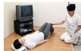
尿失禁外来 (尿もれ予防の体操指導)