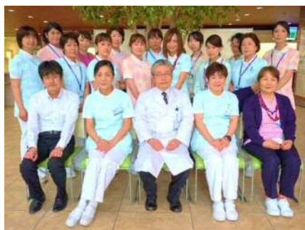
様々な職種で構成されたチームで連携に取り組んでいます。