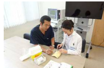
指導医による熱心な指導