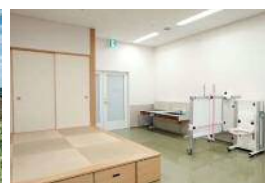
日常生活動作訓練用の 畳スペース