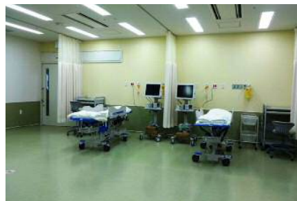
中等症対応スペース

「市民ニーズに応える救急！」を基本コンセプトに医療スタッフの総力を挙げて成人疾患の二次救急医療の充実・強化を図ります。