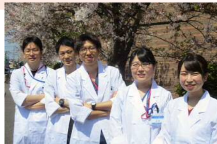
若い力が病院に活気を与えています