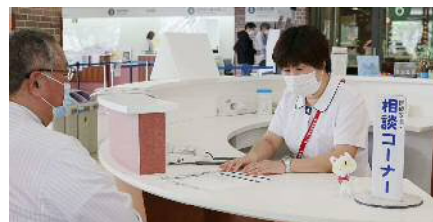
医療安全・相談コーナー