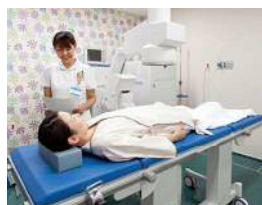
体外衝撃波結石破碎装置 1990年に川崎市内で第1号を導入して以来、当院では3台目