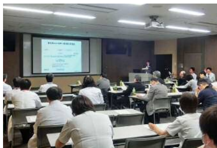
地域の医療機関との症例検討会風景