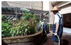
中庭の手入れをする園芸ボランティア