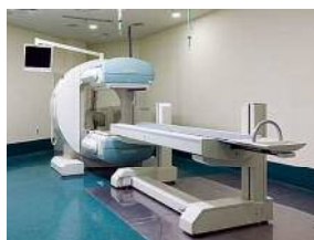
アイソトープ(核医学)検査室