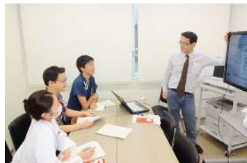
24時間使用できる医師看護師研修室