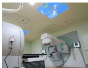
放射線治療室(リニアック)