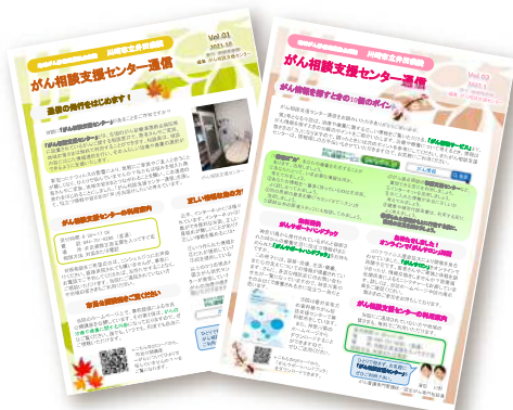
がん相談支援センター通信