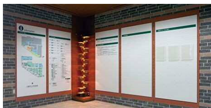
エントランス掲示板

1・2階吹き抜けで、自然光を利用した全面ガラス張り。中央にシンボルツリーを設置し、木のぬくもりを感じさせる暖かきでゆったりとしたエントランスホールとなっています。