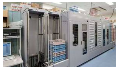
全自動注射薬払出装置