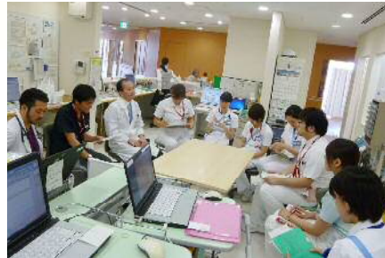
糖尿病治療にあたる多職種によるチームの合同カンファレンス

また、高齢者の病状評価と在宅ケア・施設ケアへの移行を支援するとともに、緩和ケア病棟も設置しています。