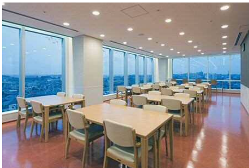
ラウンジからは横浜方面や富士山が望めます