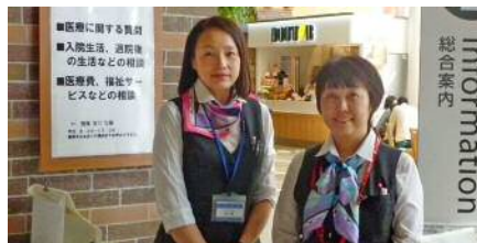
来院者を迎えるコンシェルジュ