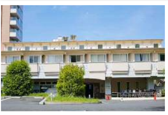
別館（緩和ケア病棟）