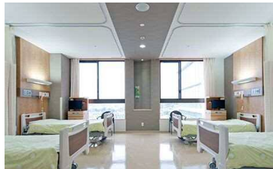
病室には洗面台、ロッカー、テレビ、冷蔵庫、セーフティボックスを用意