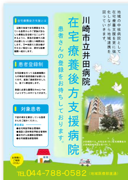
在宅療養後方支援病院ポスター