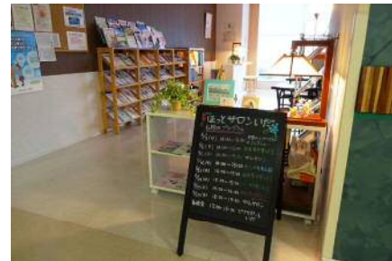
がんサロン「ほっとサロンいだ」