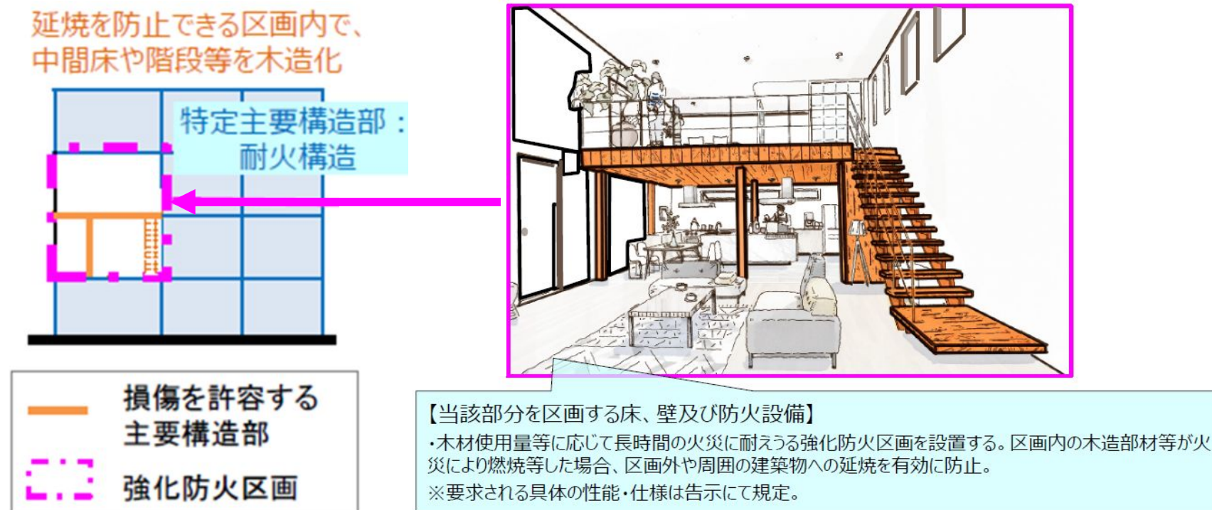
図1 部分的な木造化の例

従来、耐火性能が要求される大規模建築物においては、壁や柱等の防火上主要な部分（以下「主要構造部」という。）の全てを耐火構造にしなければならないため、部分的な木材の活用が困難であったが、耐火構造にしなければならない部分を、防火上及び避難上支障がない部分以外の部分（以下「特定主要構造部」という。）に限定することで、部分的な木材の活用を可能とする法令改正が行われた。