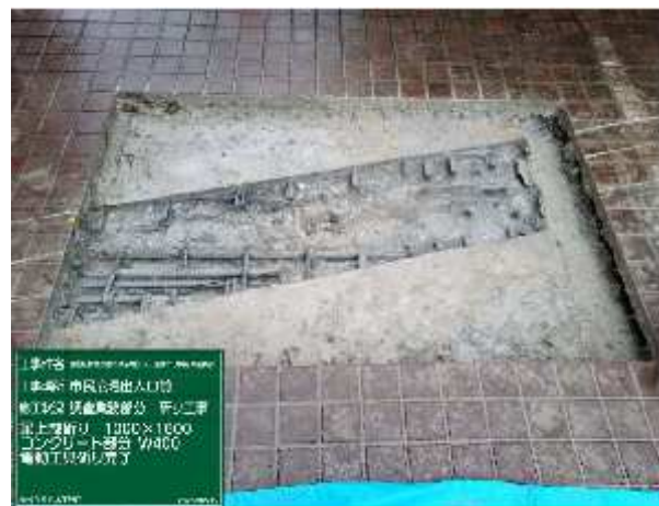
鉄筋切断状況（床面）