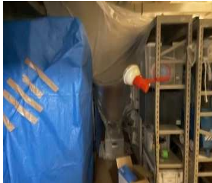
事故後の倉庫内養生