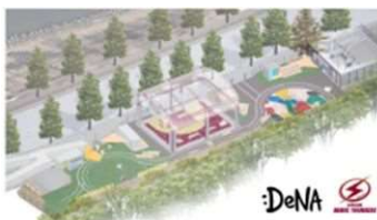
▲カワサキ文化公園