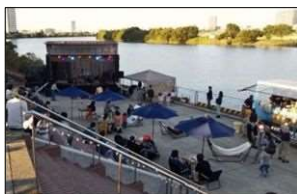
▲多摩川見晴らし公園

みどりを活かすことで、川崎駅周辺の生活の質の向上や地域価値の向上に取り組めます。