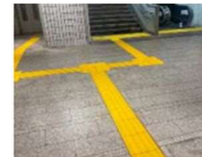
▲アゼリア 点字ブロック