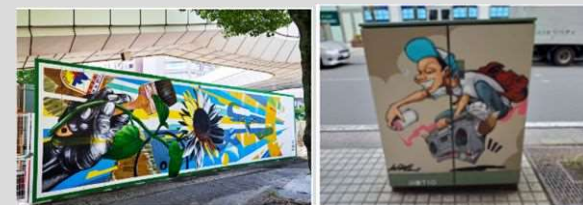
[すべて川崎市資料]