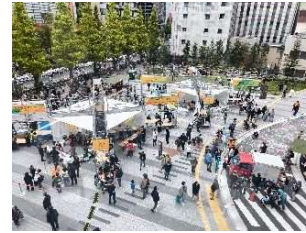
▲市役所広場の活用

また、道路・公園等を活用したイベントの開催など公共空間の有効活用により、えき・まち・みち・かわが一体となった賑わいづくりや中心市街地の更なる活性化を推進します。