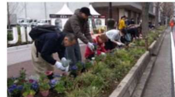
▲協働の取組（富士見公園前）