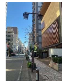
▲旧東海道のまちなみづくり