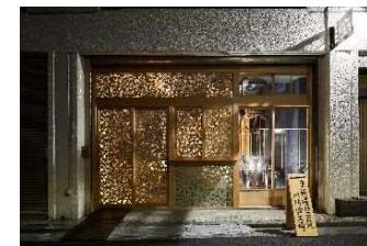
▲既存ストック活用事例 [川崎市資料]