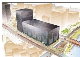
▲カワサキ アリーナシティ プロジェクト

今後、京急川崎駅周辺など未開発エリアのポテンシャルを官民連携により最大限に引き出すとともに、多様な都市機能が集積した都市拠点の形成を推進し、本市の玄関口にふさわしい魅力と活力あふれた安全・安心な広域拠点として、質の高いまちづくりを計画的に進めます。