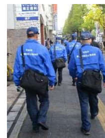
▲路上喫煙防止指導員による巡回活動

また、カワサキ アリーナシティ プロジェクトを契機とした川崎のシンボルとなるような空間の検討・整備を進め、「川崎らしさ」を感じられるまちづくりを推進します。