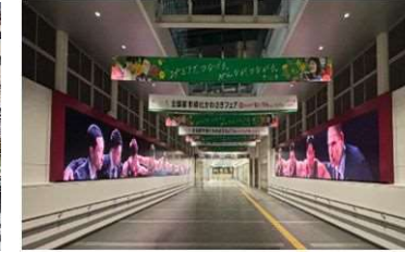
▲JR川崎駅北口通路LEDビジョン ▲水曜ナイトライブ