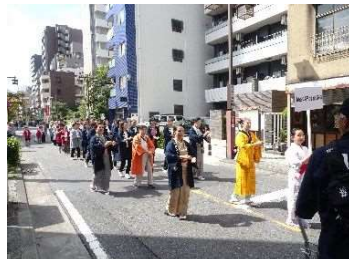
▲東海道川崎宿まつり