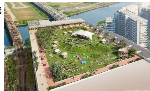
▲ルーフトップパーク開発 イメージビジュアル