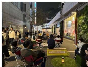
▲歩行者専用道路を活用した社会実験

さらに、引き続き、客引き行為等の防止に向けた取組、路上違反広告物等の除却指導、防犯カメラ設置支援等の継続的な実施などにより、誰もが安全・安心で快適な通行環境の構築を図ります。