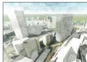
▲京急川崎駅西口地区 第一種市街地再開発事業