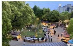
▲稲毛公園カンパイビアデイ