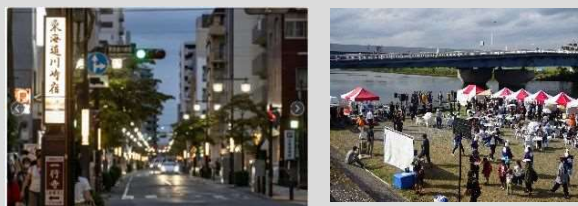
[東海道川崎宿HP、川崎市資料]