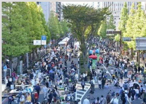
参考：来場者数10.7万人（R7）