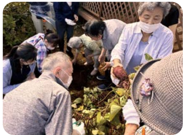
芋掘りなど、おしゃべり以外の活動も

認知症の人や地域の人が集まり、楽しいひとときを過ごしています。誰でも参加できるので、ぜひお越しください。