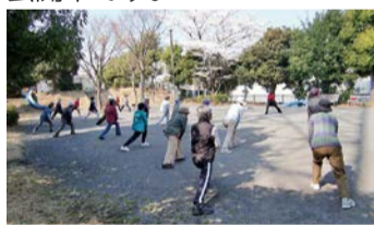
公園での健康づくり

多様な主体との連携により麻生区らしい地域包括ケアシステムを推進し、誰もが安心して暮らせるよう、支え合いの地域づくりに取り組みます。麻生区オリジナル体操の動画も公開中です。