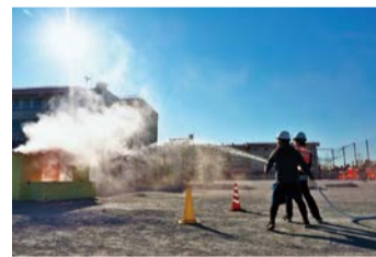
自主防災組織による放水訓練

地域や団体が連携した「区総合防災訓練」の開催や、防災ハンドブックや動画配信による防災啓発により、地域全体の防災意識やスキルの向上を図ります。