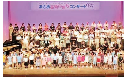
令和元年のコンサート