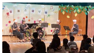
昭和音楽大学との連携による 交流コンサート

子育て情報の提供や安心して育児ができる環境づくりなど、地域ぐるみで子育て家庭を支える取り組みを推進します。区内の大学と連携し、専門性を生かしたイベントも実施しています。