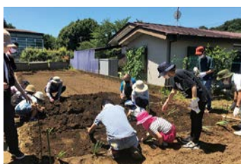
伝統野菜づくりを通じた多世代交流

「麻生市民交流館やまゆり」を通じた新たなコミュニティづくりの支援、町内会・自治会への活動支援、スポーツ活動支援などによりコミュニティの活性化に取り組みます。