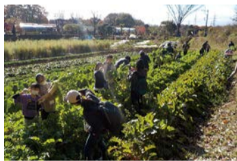
黒川での収穫体験

大学や農家の人と連携した収穫体験など、地域資源を活用して地域交流を図る取り組みを行います。また、SDGs推進に向けた取り組みを行い、持続可能なまちづくりを目指します。