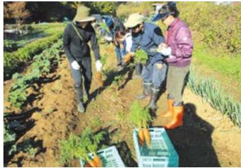
ニンジン収穫の様子

「みのり塾」では地域農業者が講師となり、市民に農作物の栽培方法や里山の管理方法を指導し、援農ボランティアとして活躍してもらう人材の育成に取り組んでいます。