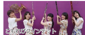
こもれびクインテット