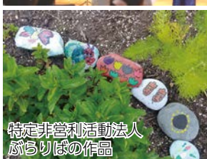
特定非営利活動法人 ぶるりばの作品