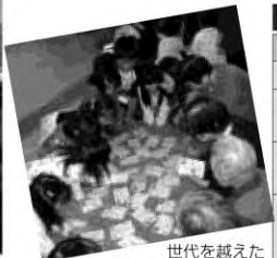
世代を越えた交流をサポートしました

六月末で任期満了を迎える第2期区民会議。二月七日(日)には、区民会議フォーラムの企画として特別ゲストを招き「地域の課題は地域で解決」をテーマに地域力アップの方法を考えます。