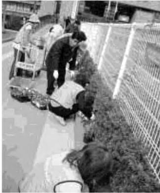
地域力アップを目指そう