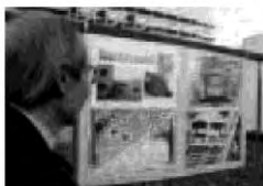
思わすうなります

駅周辺に絵を飾ります。小学生が描いた絵は約二百五十枚。発想豊かな色とりどりの絵が駅前を飾り、四月二十日、五月七日の間、「川崎・しんゆり芸術祭」に来てくれた人への歓迎ムードを演出します。 場所 新百合ヶ丘駅北口小田急線沿い 区役所企画課 ☎(965) 5112、FAX(965) 5200