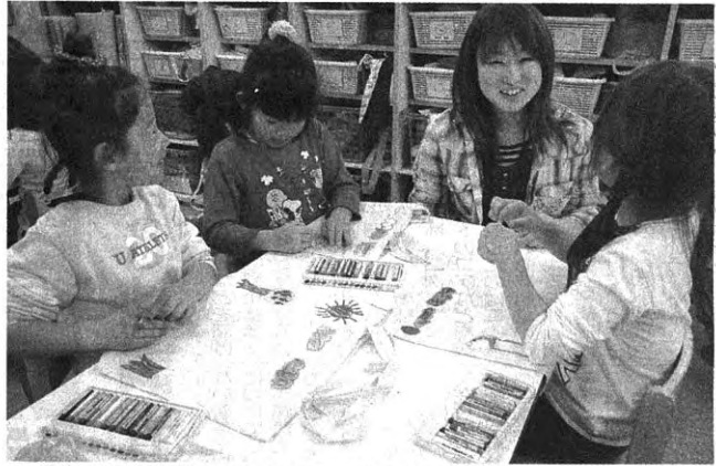
学生と会話を弾ませながらエコバッグに絵を描く園児 ＝川崎市立虹ヶ丘保育園