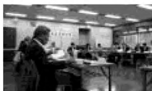
多くの意見が出されました

地域交流部会からは「川崎・しんゆり芸術祭」の開催に合わせた小学生の絵画展示や美化清掃活動の実施報告がありました。