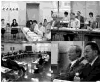
熱い議論を交わしてきました（第2期区民会議より）