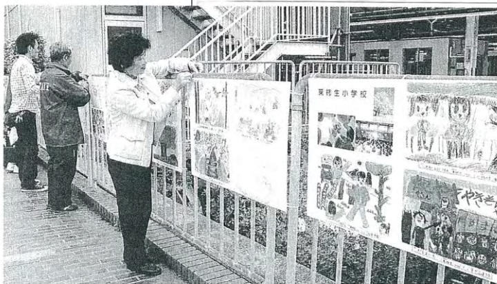
「川崎・しんゆり芸術祭」を前に、約90枚あるフェンスに飾り付けられた児童たちの絵(20日、川崎市麻生区の小田急線新百合ヶ丘駅前)