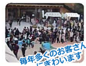
毎年多くのお客さんにぎわいます