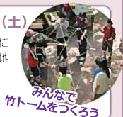
みんなで竹ドームをつくろう