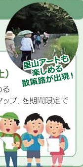
里山アートも楽しめる散策路が出現！