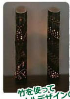
竹を使ってオリジナルデザインのあんどんづくり☆

場所：農業倉庫前 集合：セレスモス横の広場 9:00 対象：小学生（5～6年生）、中学生 参加費：無料 定員：20名 申込：必要（先着順）