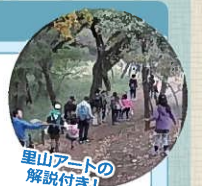
里山アートの解説付き！

集合：黒川駅南口 9:30、10:30（2回） 申込：必要（先着順） 定員：30名 参加費：無料 対象：どなたでも