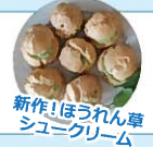
新作！ほうれん草シュークリーム