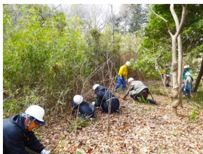
A班（親子・初心者） の作業風景