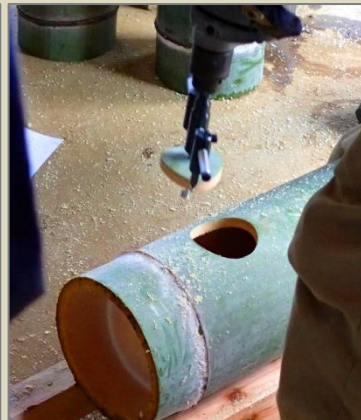
裏側の穴あけ (LED ライト用)