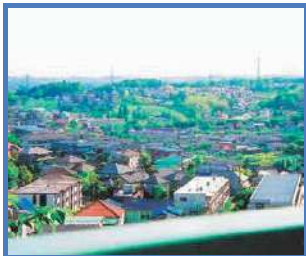
勝坂からの眺望 晴れた日には富士山が見える