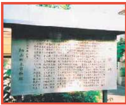
七国峠 (武蔵、相模、伊豆、駿河、甲斐、上総・下総、常陸) 七つの国を見渡すことが出来たのが由来