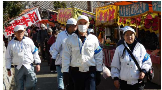
(愛のパトロールの様子)