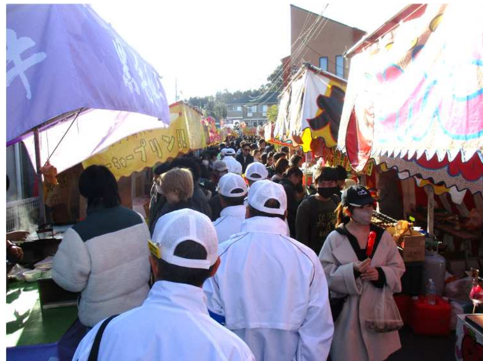
愛のパトロールの様子