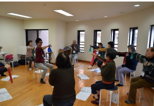
▲「青春健康講座」(セラバンド体操)

ための活動にもなっているようです。 栗木台地域包括支援センターは、気軽に誰でも立ち寄り、認知症の正しい理解を深め、認知症にやさしい街になるよう今後の更なる展開を模索しています。