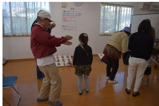
▲「みんなで麻茶房」(輪投げコーナー)

片平地域に、子どもからお父さんお母さん、おじいちゃんおばあちゃんまで、すべての世代を「ミックス」し、顔の見える関係づくりを目指すことを目的とした『片平ミックスの会』が新たに立ち上がりました。 きっかけは、地域の方が岡上地域での地域交流などを目的とした「岡の上カフェ」に参加したことで「片平地域でも多世代交流を通じて地域の結びつきを強くし