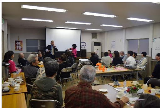
▲「マロンカフェ」(映画上映会/協力:日本映画大学)

認知症の人と家族、地域住民など誰もが参加でき、集う場が「認知症カフェ」。区内11ヶ所で実施しています。 栗木台で開催している「マロンカフェ」は、栗木・栗木台在住の住民が認知症フォーラム講座に参加した際、「認知症の方も介護をしている家族も、気軽にコーヒ