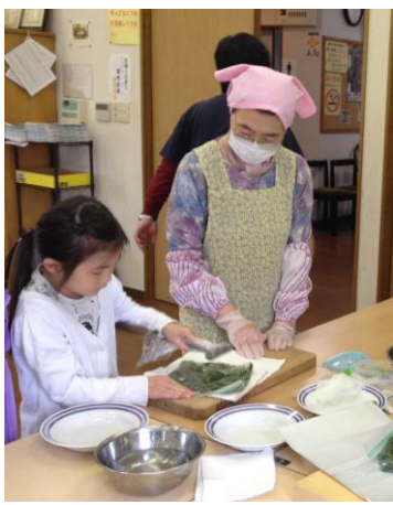
▲よもぎ団子づくり

子どもから高齢者まで、世代や地域を問わず、だれでも気軽に集える場として、平成29年4月から始まりました。岡上町内会と民生委員・児童委員が主体となり、地域のボランティアさんのご協力を基に、片平地域包括支援センターと区役所地域みまもり支援センターが後援し、岡上公会堂で毎月第4土曜日の午前10時から12時30分まで開催しています。参加費は100円。参加者とスタッフが協力して調理したものを、みんなで風ご飯として食べます。6月は「七夕飾り」、12月は「しめ飾り」を作ったり、お手玉や折り紙、紙飛行機を作