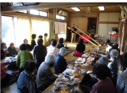
▲アルペンホルン演奏鑑賞

つて遊ぶなど、日本の文化や伝統行事を、子どもたちが楽しみながら体験できる機会となっています。また、食材や資材を地域の方から提供していただくこともあり、地域のネットワークも広がっています。核家族が進む中で、普段交流する機会が少ない世代間での触れ合いができる、貴重な場です。