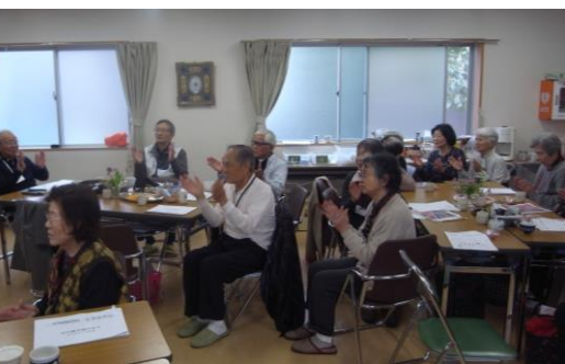
▲みんなでコグニサイズ