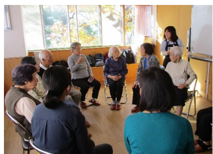
▲輪になって しりとり

川崎市では、子どもから高齢者まで、誰もが住み慣れた地域で安心して暮らし続けるために、地域ぐるみで見守りや支え合いの仕組みづくり(地域包括ケアシステム)を進めています。そこで、すでに麻生区で実施されている、地域の方による住民同士の支え合い活動の一部をご紹介します。