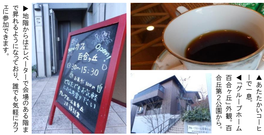
▶地階からはエレベーターで会場のある階まで昇れるようになっており、誰でも気軽にカフェに参加できます。

「カフェ百合ヶ丘」は毎月第3火曜日の午後1時半～3時半に開催されています。参加費は100円で、どなたでもこの集いに参加することができます。歌の会や、映画鑑賞会、クリスマス会などが行われるときもあります。