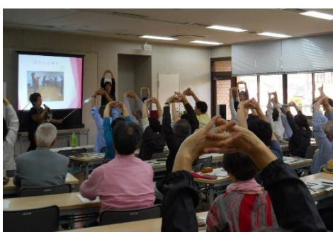
▲昨年5月に開催された麻生区地域包括ケアシステム講演会で「はつらつ会」は、活動発表を行いました。たくさんの区民の前でコグニサイズを披露し、会場を大いに沸かせました。