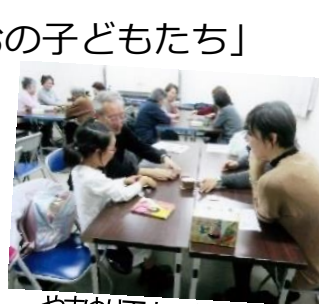
やまゆり百人一首の会