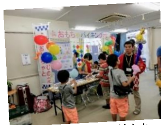
ビバ！あさおの子どもたち

年3回発行の「あさおふれんず」「やまゆりニュース」で活躍中の市民活動団体や麻生区内の情報を掲載中。交流館やまゆりや区内公共施設で配架しています。