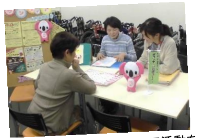
あなたにあったボランティア活動を探そう手伝い

麻生区内のボランティア情報をまとめた、「ぼらぼら広場」を奇数月の20日前後に発行しています。麻生区社会福祉協議会のホームページからも見ることができます。