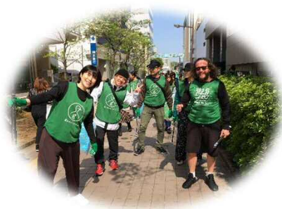
麻生区の「まちのひろば」

「まちのひろば」の現状を知らなければ、よりよい未来を検討することはできません。 活動をしている人が何を考え、何に困っているのかなどを知るために、まずは「まちのひろば」に行って、活動している人から話を聞いてみましょう！