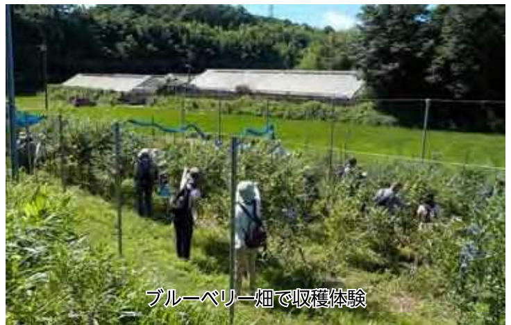
ブルーベリー畑で収穫体験