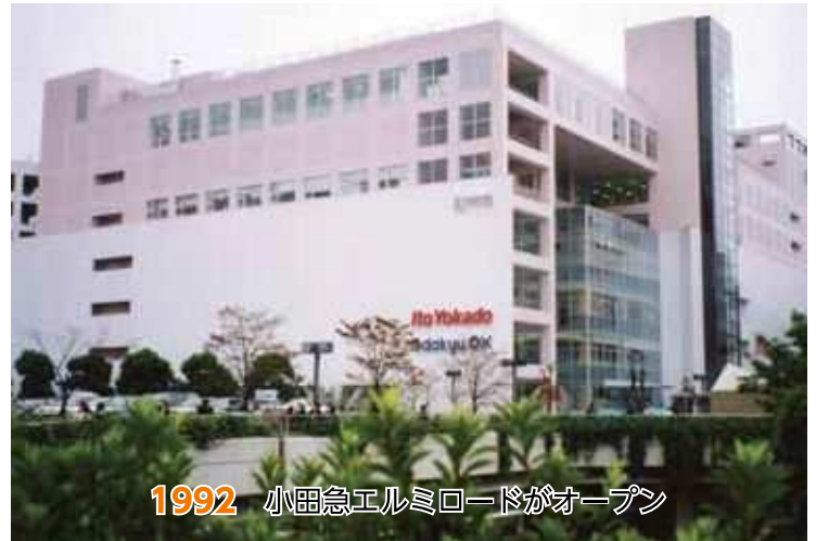
1992 小田急エルミロードがオープン