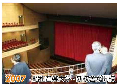
2007 昭和音楽大学・新校舎が開校