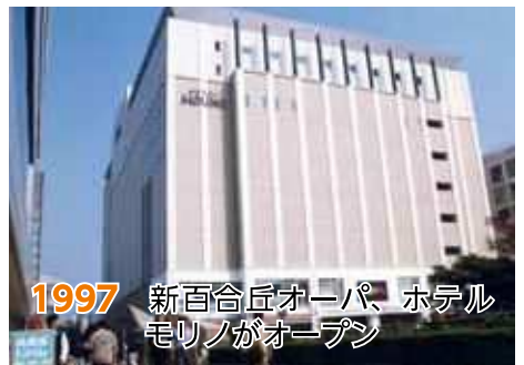
1997 新百合丘オーパ、ホテルモリノがオープン