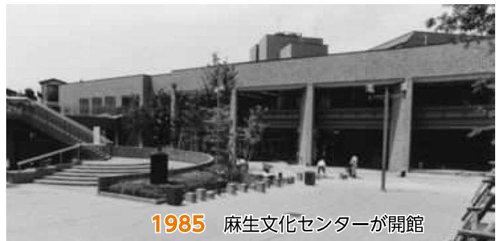
1985 麻生文化センターが開館