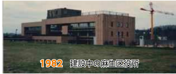
1982 建設中の麻生区役所