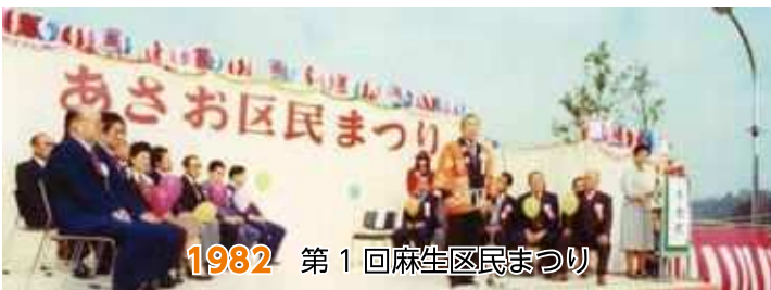
1982 第1回麻生区民まつり