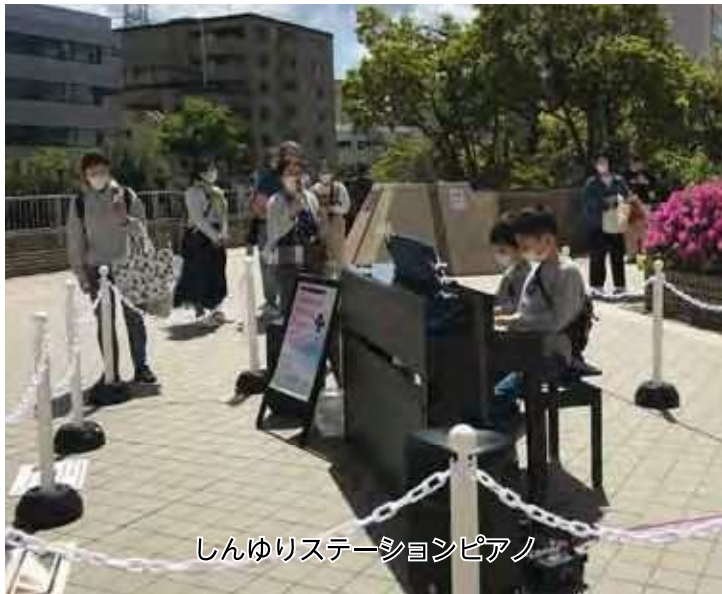
しんゆりステーションピアノ