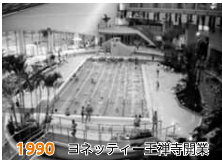
1990 ヨネッティー王禅寺開業