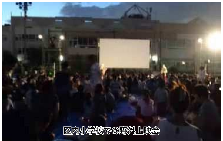
区内小学校での野外上映会