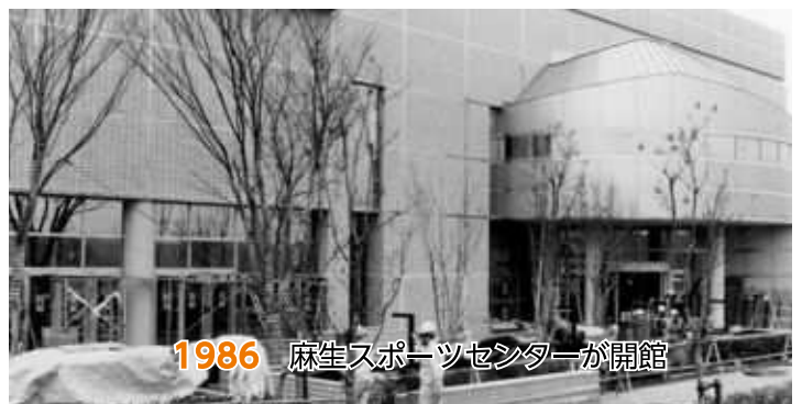
1986 麻生スポーツセンターが開館