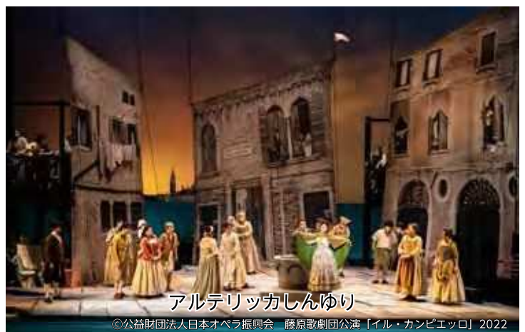
アルテリッカしんゆり