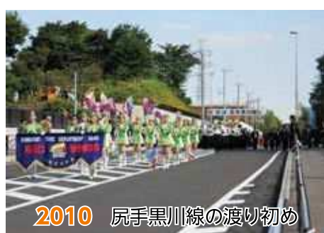
2010 尻手黒川線の渡り初め