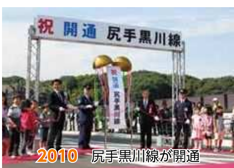
2010 尻手黒川線が開通