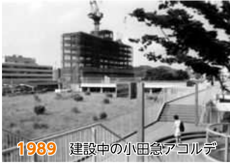
1989 建設中の小田急アコルデ