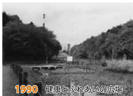
1990 健康とふれあいの広場