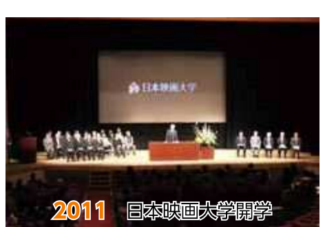
2011 日本映画大学開学