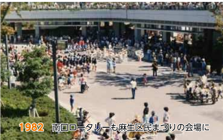
1982 南口ロータリーも麻生区民まつりの会場に