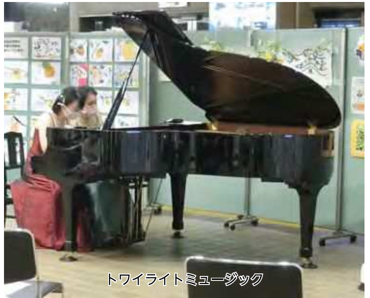
トワイライトミュージック