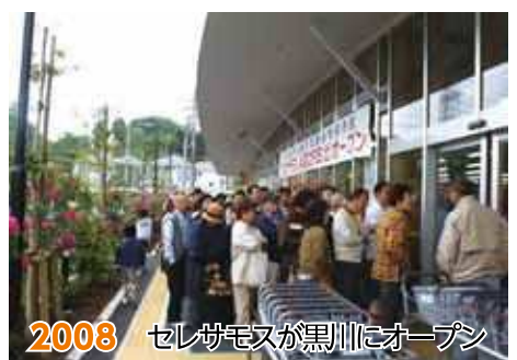
2008 セシガモスが黒川にオープン