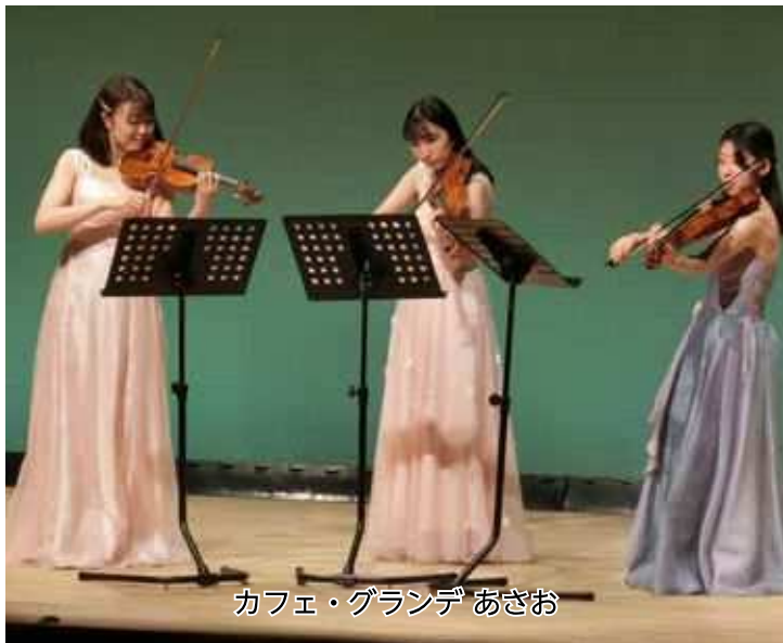
カフェ・グランデ あさお