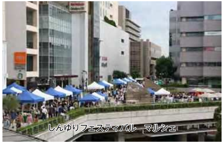
しんゆりフェスティバル マルシェ