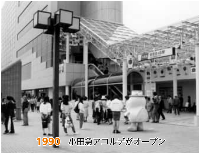
1990 小田急アコルデがオープン