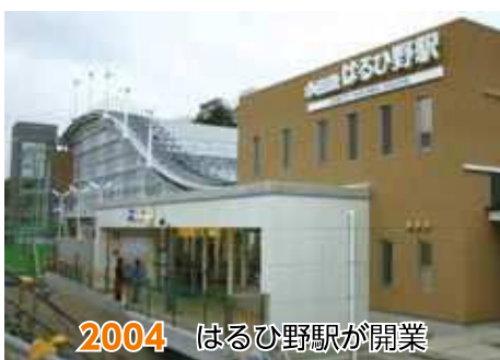
2004 はるひ野駅が開業