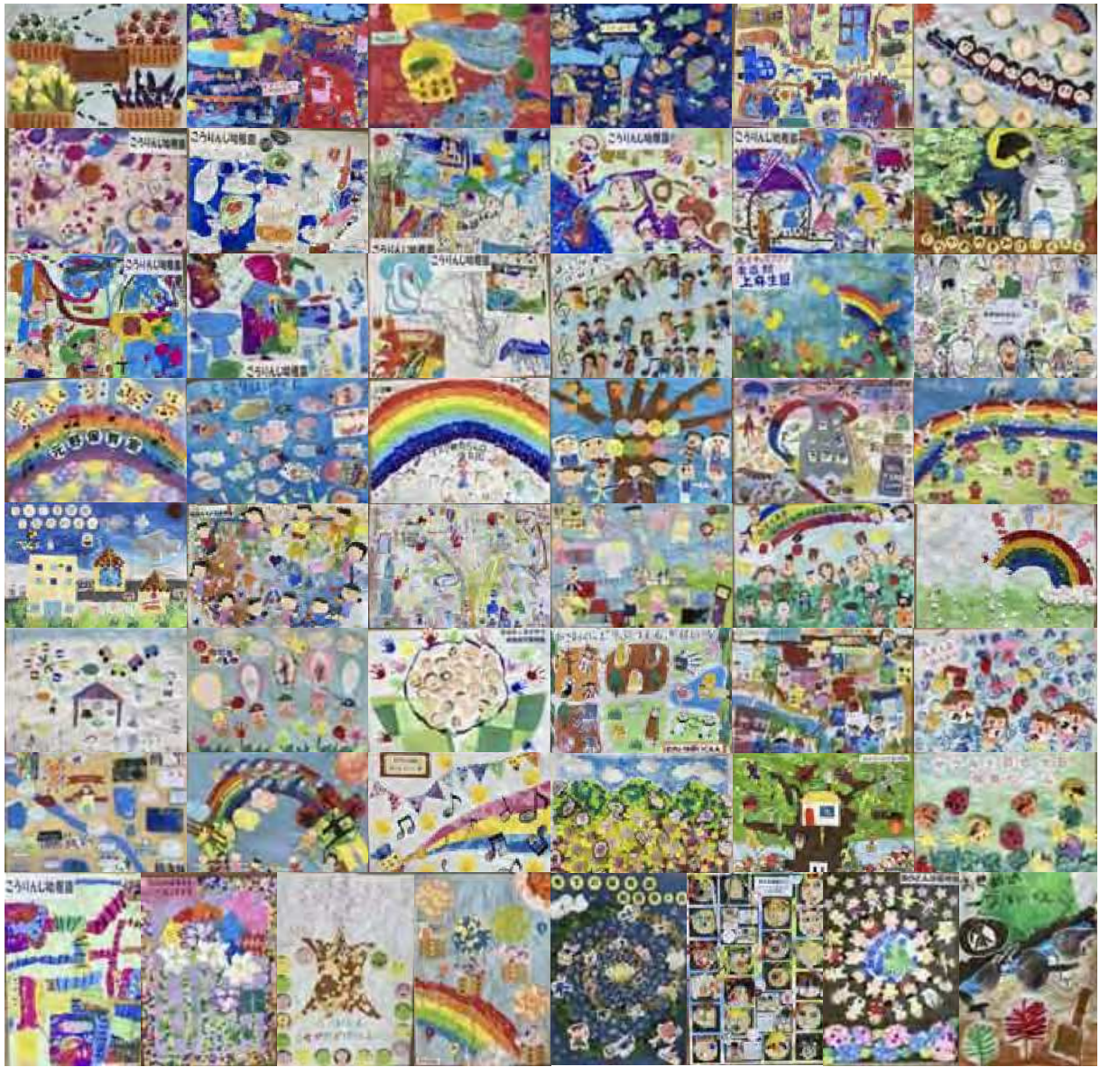
「あさおの未来」をテーマに区内の園児が描いた作品です