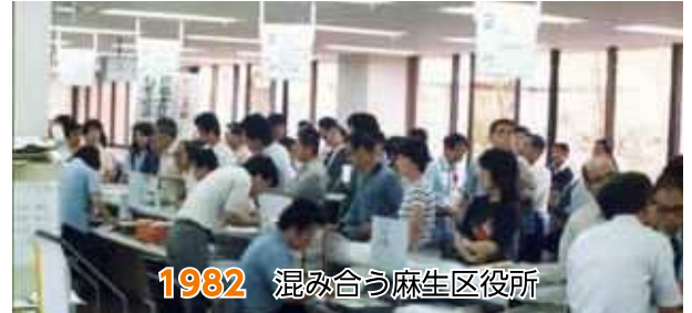
1982 混み合う麻生区役所