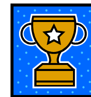
今年も優勝の片平Aチーム