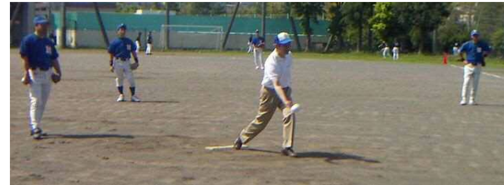
始球式でもナイスピッチング

麻生区では「スポーツのまちあさおの推進」を一つの目標としており、麻生区にある豊かなスポーツ資源を有効に活用し、幅広い年齢層の区民の皆様が参加できる事業を展開しております。地域スポーツの発展により、体力・健康の増進だけではなく区民同士の交流の輪を広げ、生涯スポーツを楽しみ、地域が一体となれる元気なまちづくりに取り組んで参りたいと考えております。