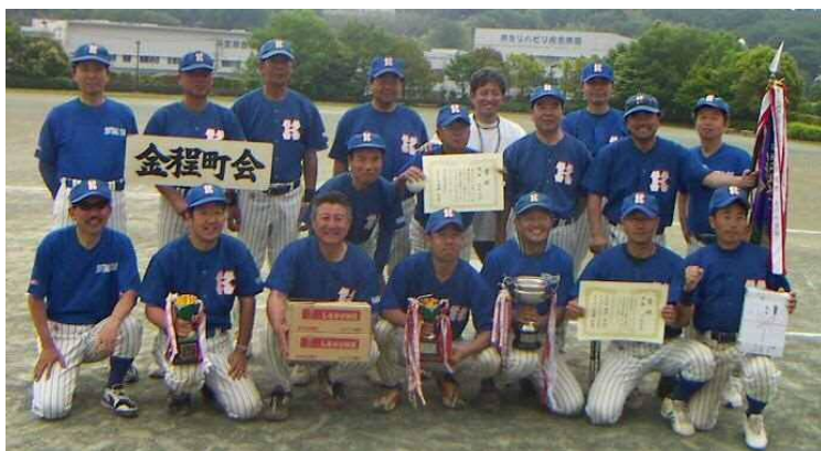
優勝した金程町会チーム

今回の大会は16チームの参加がありました。壮年の大会という事で、参加資格は40歳以上、ルールはスローピッチです。年齢の上限は無いので、さまざまな年代の選手が参加し、また個々の技量もまちまちなので見ておもしろい試合が多くあり、非常に盛り上がりました。スローピッチは山なりの遅い投球なので初めての人はいまよく打てず1、2点で終わる試合が多いのですが、逆に今回は43対3(おそらく記録です)という試合もありました。決勝戦では常勝金程町会が13対12で勝ち、昨年に続き優勝しました。次回はここを負けずチームが出てきてほしいものです。〈木幡(義)〉