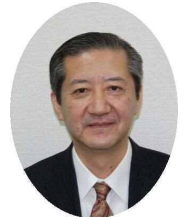
瀧崎雅介 麻生区長