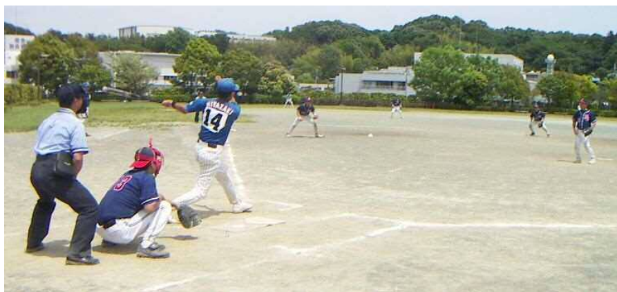
行ったか ホームラン!