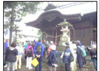
スポーツ推進委員が説明します

来年度も皆さんに喜んで頂ける歩け歩け運動を検討しております。多くの方の参加をお待ちしております。〈川岸〉