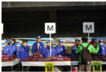
スポーツ推進委員もがんばります