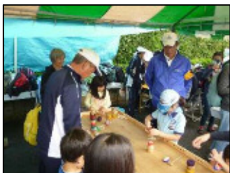
昔遊びに子どもも大人も夢中です