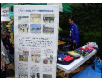
ニュースポーツの用具展示