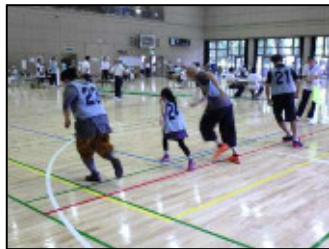
シャトルラン 無理をしないでね！