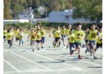
長距離走は約2キロです

晴天の下、あさお区民運動会が開催されました。 今年は、競技種目の見直しを行い、午前9時～午後0時30分過ぎまでの開催となりました。 実行委員会でよりよい運動会にしようと検討を行い、近年ではいつもより多い6町内会・自治会、14団体が町会対抗玉入れや団体対抗リレーに参加し、熱戦を繰り広げました。 また、一般参加者も交えた徒競走・長距離走・パン食い障害物競走なども、参加予定人数を上回る種目が有り、盛況のうちに終わりました。〈越畑〉