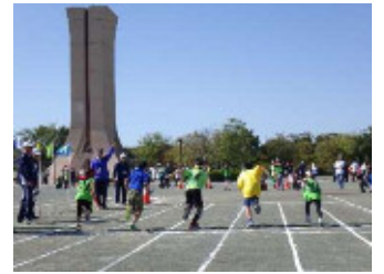
青空の下ヨーイドン!