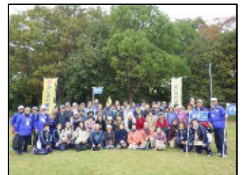
参加者全員で記念写真