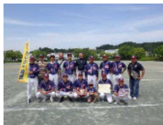
準優勝 金程富士見会