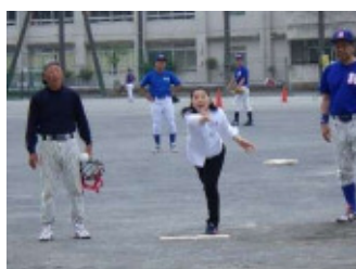
区長の始球式でプレイボール！

来年の第31回大会も、日頃から飲み過ぎに注意していただき、元気ハツラツな戦いを期待しています。〈五味〉