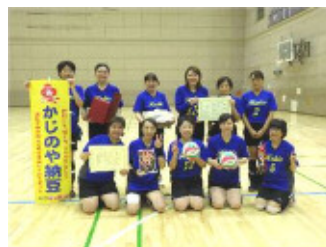
第3位 柿生（片平町内会B）