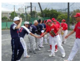
試合が終わればナイスゲーム！