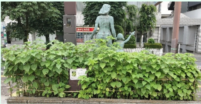
麻生区役所母子像の所に自生しているカラムシ