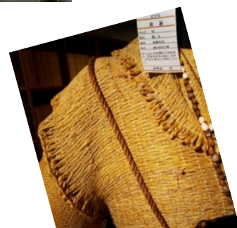
東京都埋蔵文化センターの 展示資料から