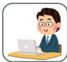
病院の庶務課担当者

お申し込みありがとうございます。では、△日ということで、9時45分に2階の庶務課集合でお願いします。