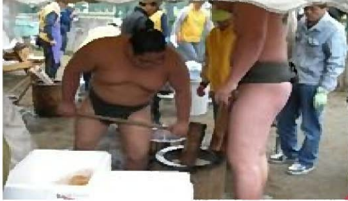
春日山部屋の力士によるお餅付き