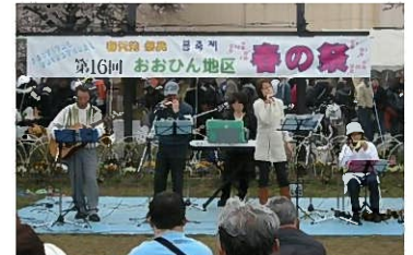
ザ・のんべーずによる演奏

4月4日(日)桜川公園で「第16回おおひん地区『春の祭』」が開催されました。満開の桜に囲まれた園内では、町内会などによる模擬店やバザーが多数出店しました。