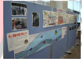
川崎西部まちづくりクラブの展示

20年度に実施された国道15号JR南武線ガード下壁画制作の様子を展示した他、新たに描く予定の壁画のデザイン案の下絵に、自分で彩色した花や蝶を貼り付けてもらうなど、来場者にも参加してもらえる工夫をしました。