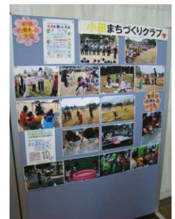
小田まちづくりクラブの展示

夏と新春お楽しみ大会の写真及び駕籠の実物を展示しました。また、長年にわたりクラブの主要テーマとして取り組んできた小田公園のリフレッシュ案をまとめた「小田公園魅力アップ作戦」もお披露目しました。