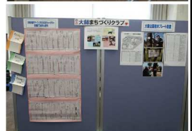
大師第1・2・3まちづくりクラブの展示

第13回を迎えた「かわさき大師サマーフェスタ」のクイズラリーの様子や石観音で読まれた俳句などを展示しました。