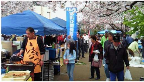
【模擬店からは美味しそうなおいが…】