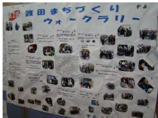
渡田まちづくりクラブの展示