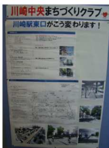
川崎中央まちづくりクラブの展示

川崎駅前広場のリフレッシュ及びバリアフリー化のイメージについての展示を行いました。