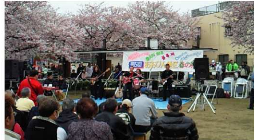
【ブラックシーサーによる演奏】

ステージでは、区の音楽事業「いつでも誰でもコンサート」や地元幼稚園の園児によるダンスなどが披露され、過去最高の人出を記録した昨年以上の盛り上がりを見せました。