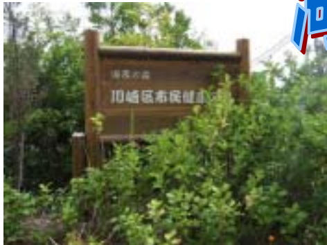
会員が持ち寄った苗木を植えた海風の森のゲート

最近、区民会議での課題解決にむけた取り組みとして、「商店街の花壇づくり」や市役所第3庁舎裏の「緑のトンネル」づくりなど、海風の森にとどまらず、大活躍の川崎区市民健康の森管理運営組織「海風の森をMAZUつくる会」ですが、本業もしっかり頑張っています!!