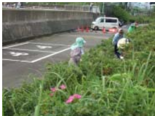
恐るべし 茅の勢い!