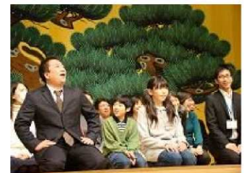
狂言の笑い方を体験

今年も、東海道川崎宿2023が企画し、川崎区内の小学校6年生を対象にした能狂言教室が12月3日に開催されました。区内全小学校に呼びかけるようになり3年、毎年参加校が増え、今年は19校1400名を超える児童・教員に能「羽衣」と狂言「柿山伏」を鑑賞し、体験してもらうことができました。