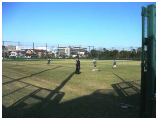
毎週水曜日午後に行われる桜川公園の地域開放の様子

主なる流れとして、美化活動による憩いの公園に地域の方とコミュニケーションづくり、毎週水曜日午後の桜川球場の地域開放による地域の子もたちの空間づくり、また、商店街の笑顔写真展などです。どうぞよろしくお願いいたします。