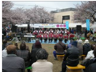
おおひん地区の春の風物詩、「春の祭」