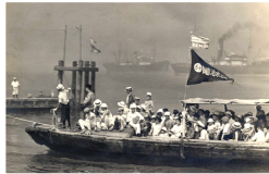
渡し船と扇島海水浴場の風景(昭和13年)