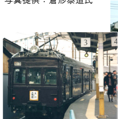
旧車両クモハ12系 (平成8年武蔵白石駅)