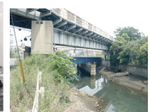
海水浴前駅と発着場があった竹の下付近の現在