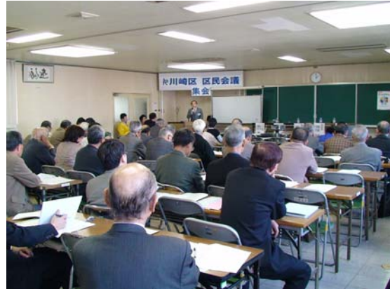
区民会議の役割や実行計画案について区民会議委員が説明