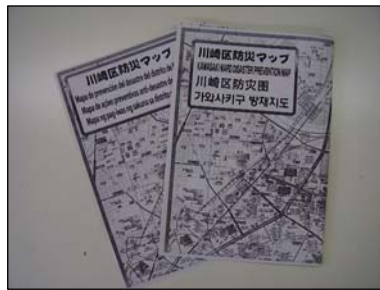
◆外国人市民のための防災マップ