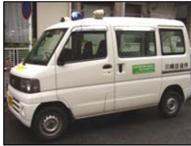
◆青色回転灯を装着した車両でパトロール