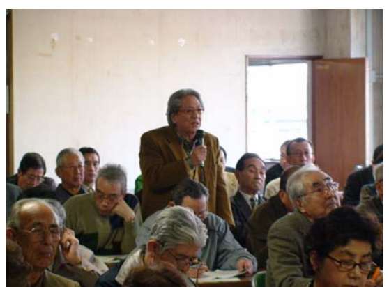
会場からも熱のこもった御意見や御要望をいただきました