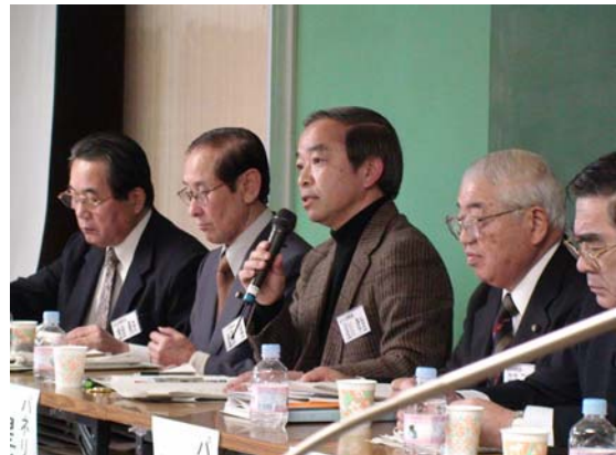
出演者は全て区民会議委員のパネルディスカッション