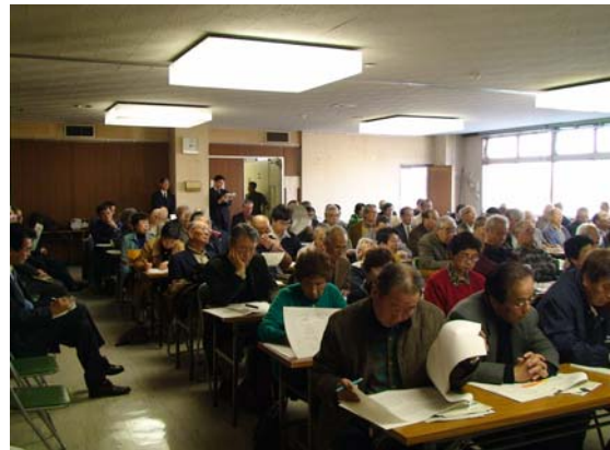
区民会議の制度やこれまでの経過についてパワーポイントで説明