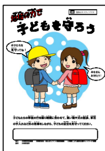
◆ 地域見守り看板を作成しました