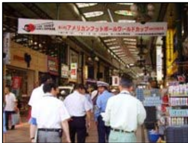
◆川崎駅東口をパトロールしました