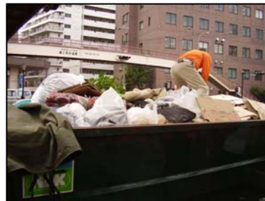
◆大量のゴミを撤去しました