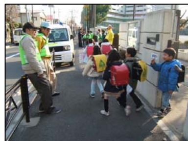
◆ 毎月1日と10日を子ども安全の日を設定して登下校時間帯などに見守りをしています