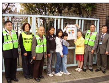
◆ 小学校や町内会館など、区内各所に掲出しました