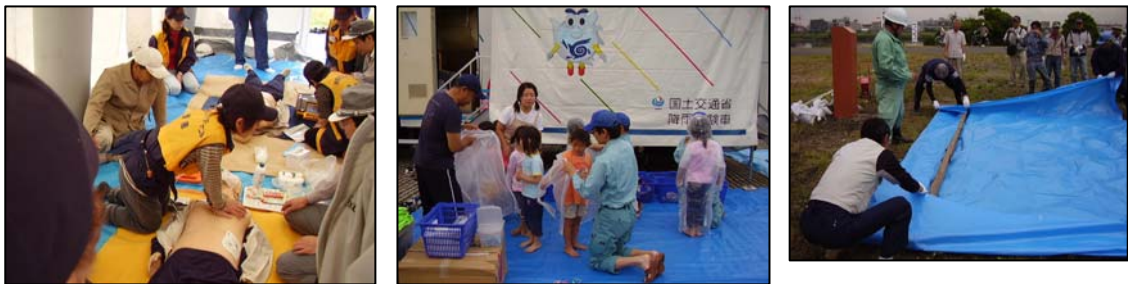
◆近隣住民の方々や子どもたちも訓練に参加しました

実施主体：国土交通省関東地方整備局京浜河川事務所、川崎市、川崎市自主防災組織 ほか