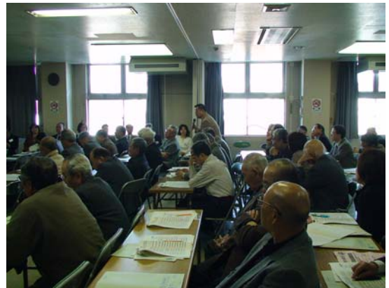
参加者からもたくさんの意見が寄せられました