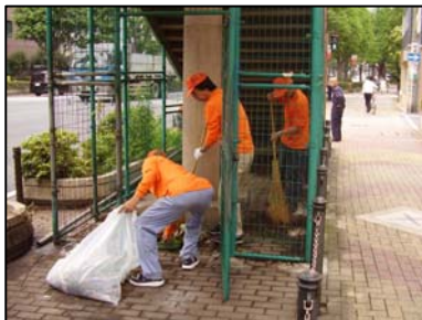
◆道路の隅々まで清掃しました