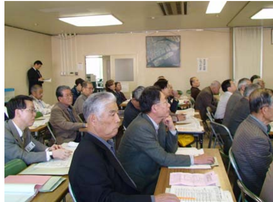
地域コミュニティの充実について参加者と区民会議委員が意見交換