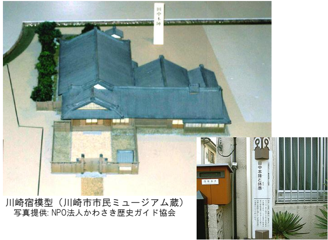
川崎宿模型（川崎市市民ミュージアム蔵）