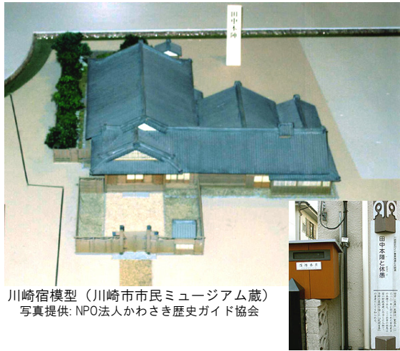
川崎宿模型（川崎市市民ミュージアム蔵）