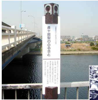
昭和25年頃の 長十郎梨園