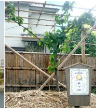
若宮八幡宮 境内に移植 された長十 郎梨の苗木