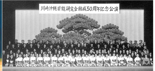
川崎沖縄芸能研究会結成50周年記念公演 昭和25年の研究会創立第1回発表会（上）と 平成13年の50周年記念公演（下）