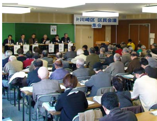
前回行われた区民会議集会の様子