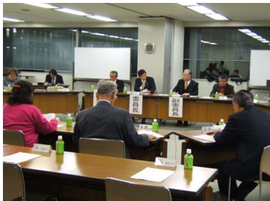
平成21年度第2回全体会議