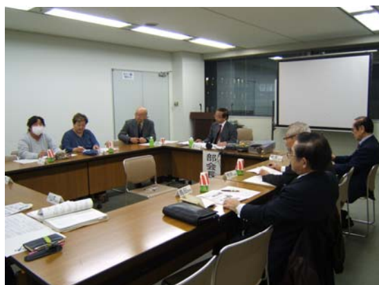
平成21年度第4回地域力・つながり部会

平成20年7月からスタートした第2期川崎区区民会議。これまでの約1年半の間に、「地域が取り組む環境エコ部会」「地域力・つながり部会」の両部会を中心に、さまざまな取り組みを行ってきました。