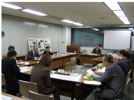
平成21年度第4回地域が取り組む環境エコ部会