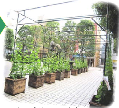
▲元気に成長しています