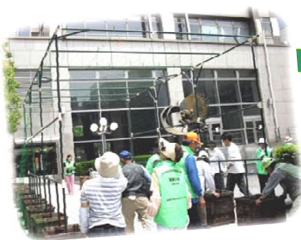
▲立派なフレームの完成

5月末、「海風の森をMAZUつくる会」と区役所の協働で、市役所第3庁舎に手作りのプランターを集めて、「緑のトンネル」を作りました。プランターにはゴーヤーと朝顔の苗を植え、プランターとつるを伝わせるためのフレームをトンネル状に組み立てました（=写真=トンネル寸法：幅3メートル、長さ6メートル、高さ3メートル／2セット）。このトンネルを囲み、下記の日程で“環境の広場展”を開催します。ぜひ参加して、トンネル内の涼しさを体感してみてください。