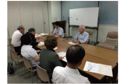
見守り活動に関する アンケートとヒアリング を実施しました