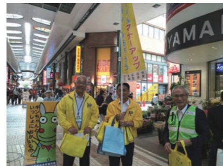
交通安全キャンペーンに 区民会議として参加しました