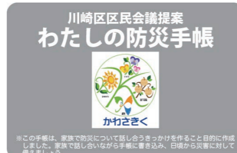
区民会議で作成した『わたしの防災手帳』

各家庭で防災について話し合うきっかけを作るため、『わたしの防災手帳』を活用し、「家族防災会議」の普及・啓発を図ります。