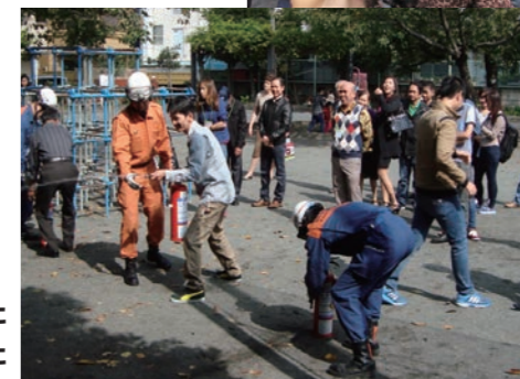
外国人市民を対象とした 防災フォーラムを実施しました