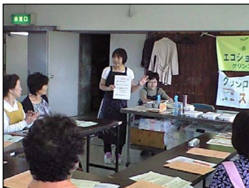
地産地消とフードマイレージについて知ろう