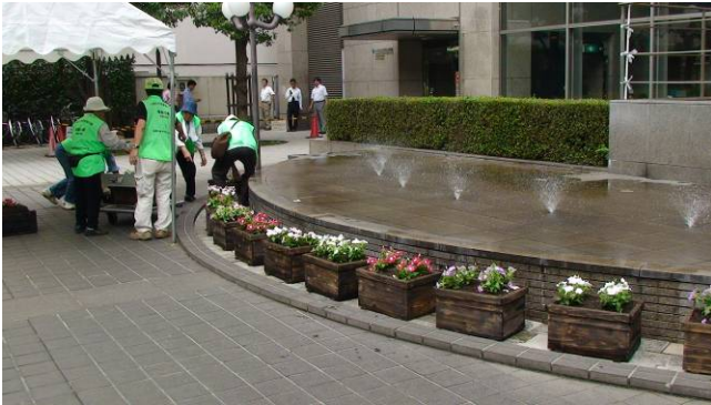
花のプランターを並べました

『環境の広場展』と題して、緑のトンネルを中心に一日だけのイベントを企画しました。直前まで雨が心配されましたが、みんなの意気込みが天に通じたのか見事に晴れわたり、夏の日射しの中での開催となりました。打ち水用に建設センターから水が運び込まれ、いざ開催！