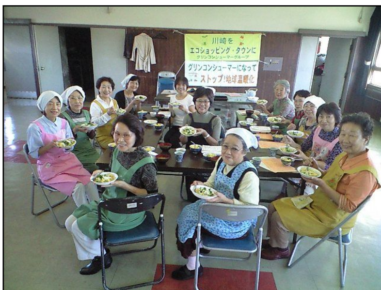
旬野菜のスパゲッティと利休白玉のフルーツポンチ