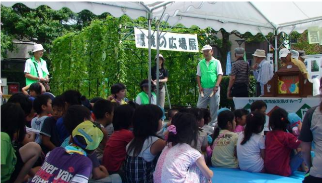
環境紙芝居を楽しむ子供たち