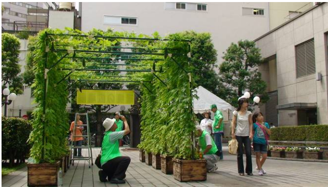
残念ながらトンネルにはならず・・・