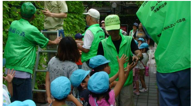
ゴーヤの収穫。我先にと手を伸ばします