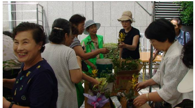
エコ生け花。とっても楽しそう