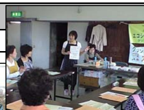
エコを学んで実践