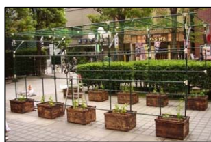
約2カ月で緑のトンネルに