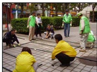
枠から手作りで製作