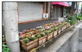
田島地区の商店街