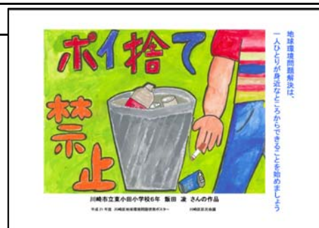
最優秀作品は印刷を