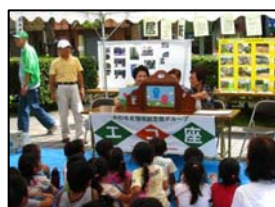
子どもたちも大勢参加