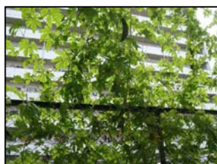
4カ所の公共施設に設置