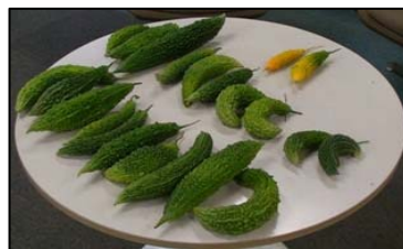
ゴーヤーの収穫も