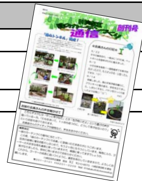
緑のカーテン通信