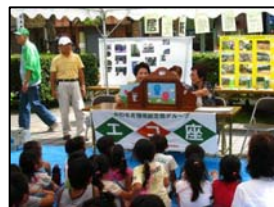
子どもたちも大勢参加