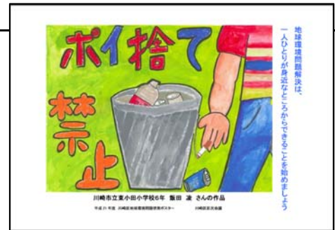
最優秀作品は印刷を