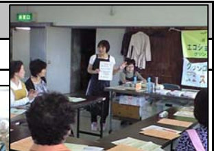
エコを学んで実践