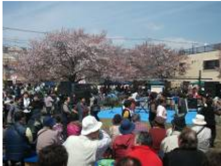
【桜を楽しむ大勢のお花見客】

国際色豊かなおおひん地区ならではの各国の郷土料理の出店や、フリーマーケット、そしてステージでは、子どもたちによるダンス、和太鼓演奏、また地域のバンドグループの演奏など、会場をわかせていました。