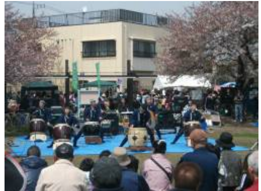
【お祭り気分を盛り上げる賑やかなステージ】

好天に恵まれた4月15日（日）、桜川公園で『第17回おおひん地区「春の祭」』が開催されました。昨年度は東日本大震災の影響により中止となったため、今年は2年ぶりの開催。晴れやかなお花見日和のなか、大勢のお花見客で賑わいました。