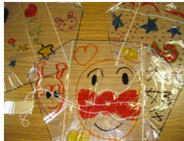
完成した凧。 新春お楽しみ大会が楽しみです。