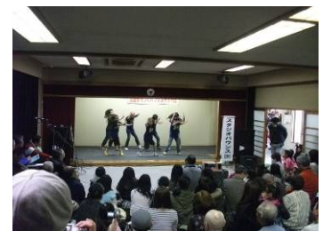
昨年の様子 （ステージパフォーマンス）