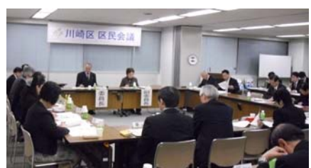
第 4 期川崎区区民会議全体会議の様子

平成 24 年 4 月より、第 4 期川崎区区民会議がスタートしました。第 3 期での取組を踏まえ、20 人の委員が地域課題の解決方法を審議します。