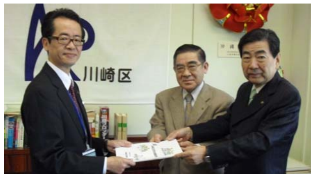
第3期区民会議津委員長(右)、島田副委員長(中)から区長(左)へ報告