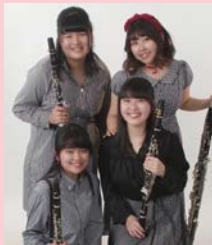
▲ケニチロカルテット

申込5月16日から電話、市版6面の必要事項を記入しFAXかメールで区役所地域振興課044-201-3127FAX044-201-3209061tisin@city.kawasaki.jp [先着順]