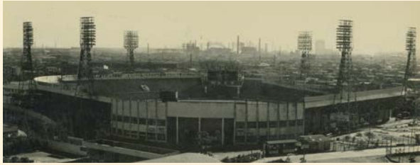
昭和44年ごろの川崎球場

川崎区は4月に区制50周年を迎えました。そこで、区の歴史を全6回にわたり、写真とともに振り返ります。