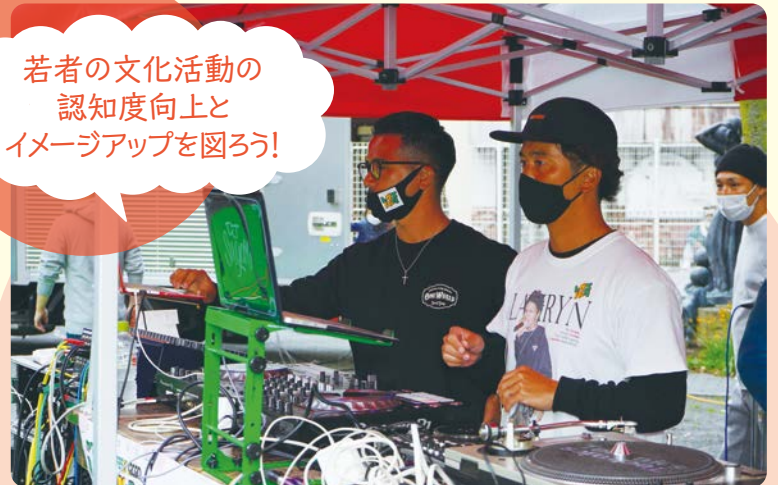
▲昨年度のイベント(東田公園で開催したレゲエパーク)の様子