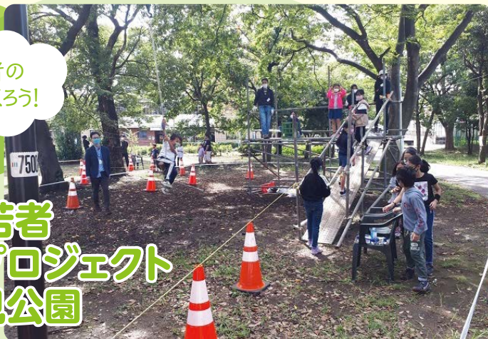
▲昨年度のイベント(富士見公園で開催したパークチャレンジかわさき)の様子

遊びを通じた場づくりである「パークチャレンジかわさき」を子どもたちと一緒に考え、作り上げた場所で楽しめます。広く区民に向けて子ども・若者の居場所づくりに対する参加意識も醸成します。