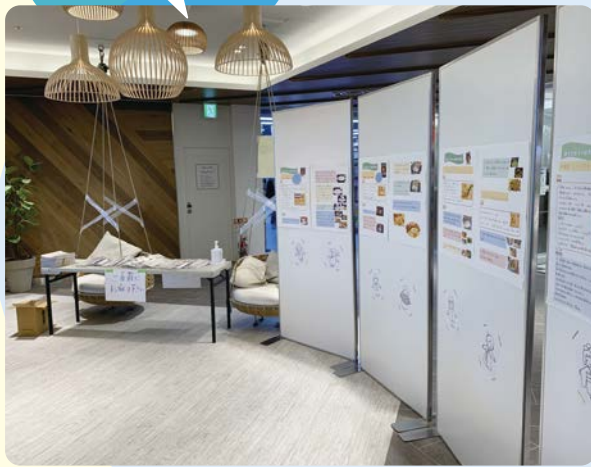
▲昨年度のイベント(川崎ルフロンで開催した多文化の遊び情報などの展示)の様子

多文化を知ってもらうイベントや、外国につながる子どもを理解するセミナー、やさしい日本語ワークショップ出前講座を実施し、多文化共生社会にふさわしい地域を築くことを目指します。