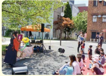
▲今年度のイベント(東田公園で開催した紙芝居の様子)

区では、地域の特性を踏まえた川崎区らしいソーシャルデザインセンターの創出に向けた取り組みを進めています。今回はこの取り組みをお互いに連携して実施している2つの事業を紹介します。